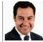
BONILLA Presidente del Partido Andalucés 03/04/2014