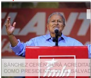
SÁNCHEZ CERÉN SERÁ ACREDITADO COMO PRESIDENTE DE EL SALVADOR