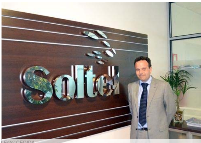
SEVILLA, 22 Mar.

13/03 a las 15:54 Jordi Sevilla y Manuel Pimentel alertan de que la incertidumbre aleja las inversiones